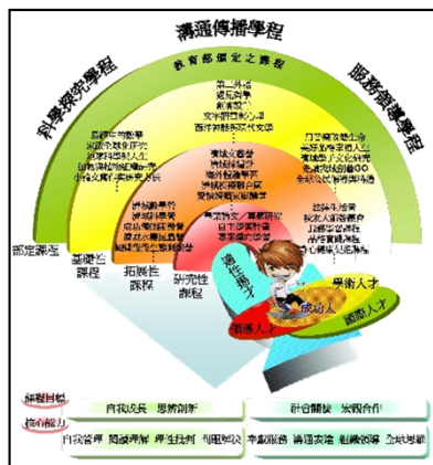
圖 1 成功高中課程地圖