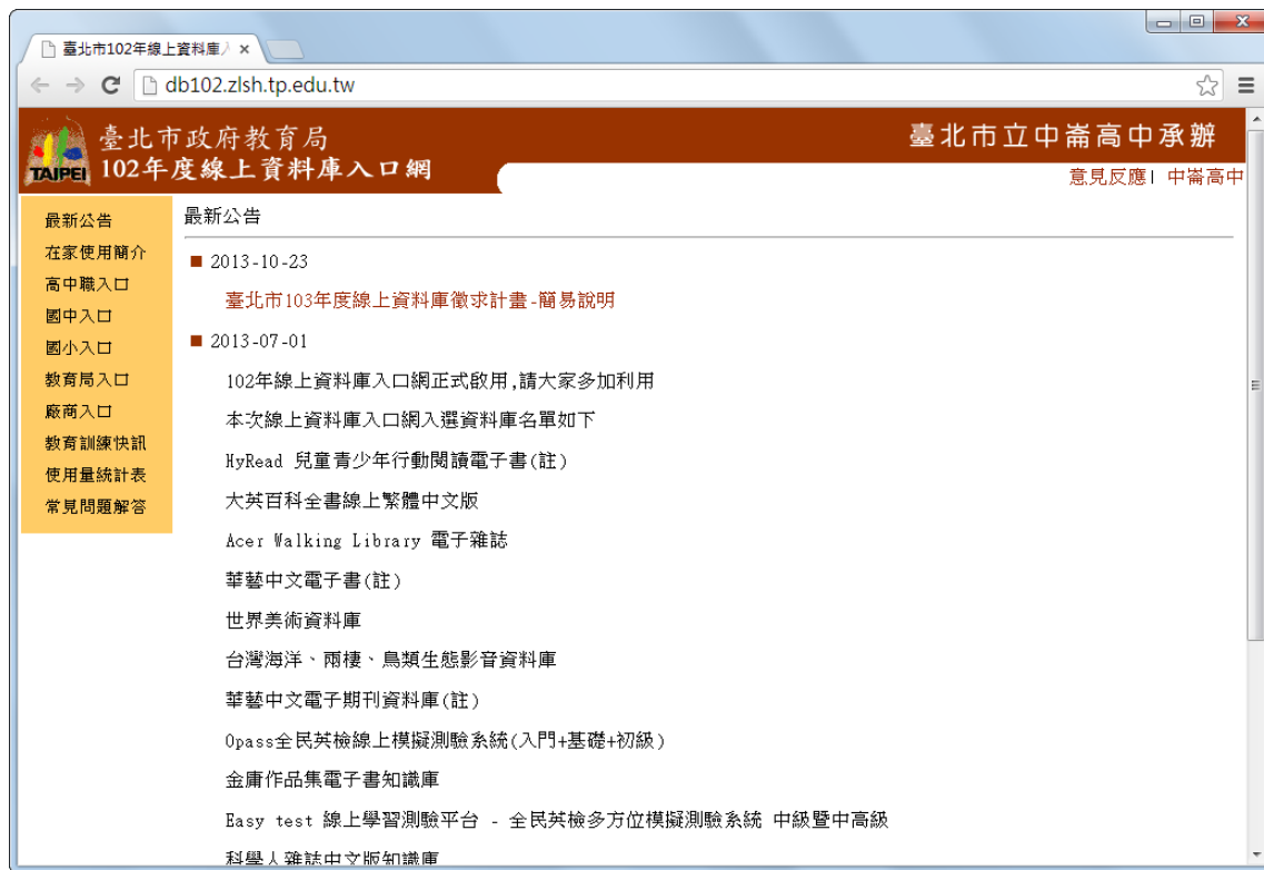
圖 3-1 臺北市政府教育局線上資料庫